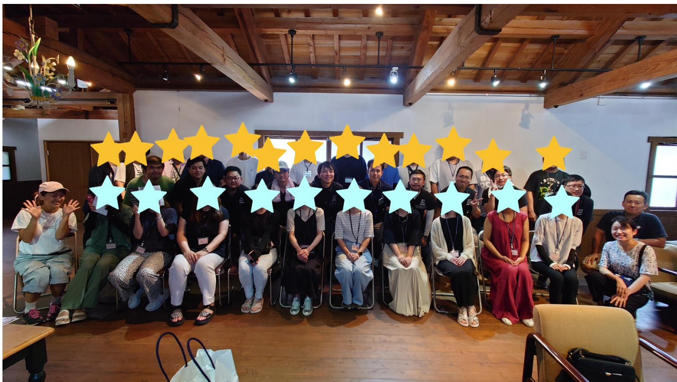
*黄色い星が男性参加者、水色の星が女性参加者。